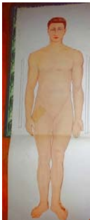
Nouvelle encyclopédie de Médecine et d'Hygiène ; Dt Pierre Louis REHM ; Librairie Quillet, 1931

Nous sommes donc bien dans un processus lent, mais continu. Nous